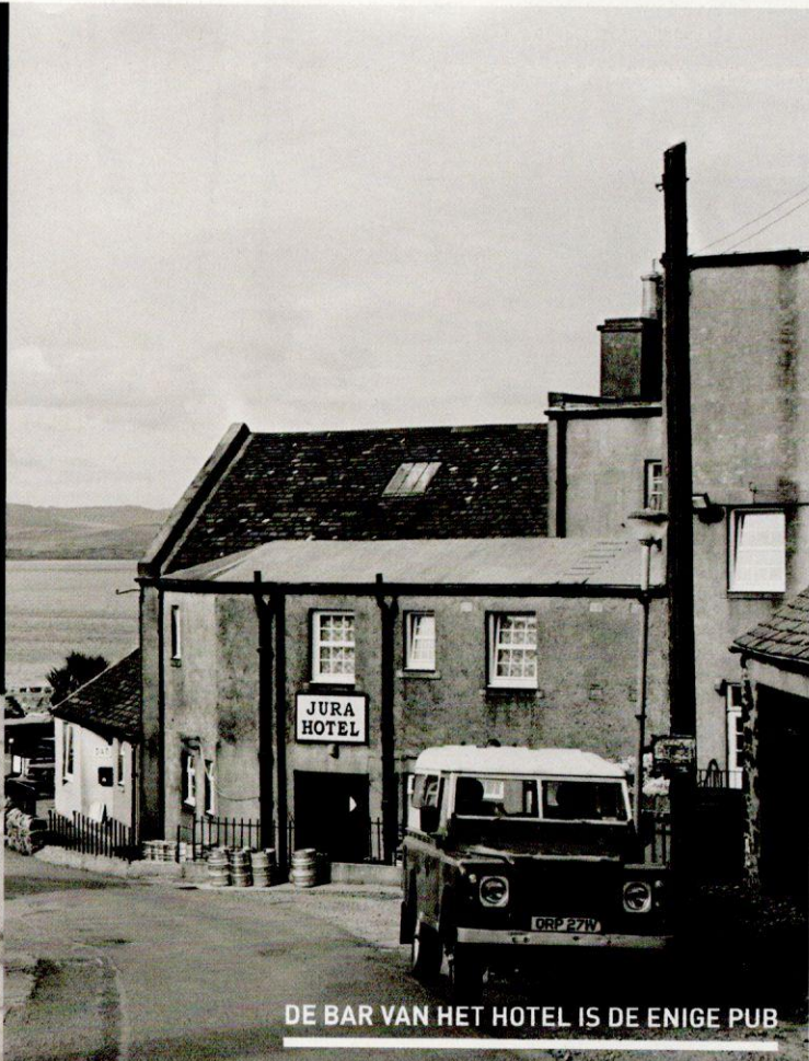
DE BAR VAN HET HOTEL IS DE ENIGE PUB